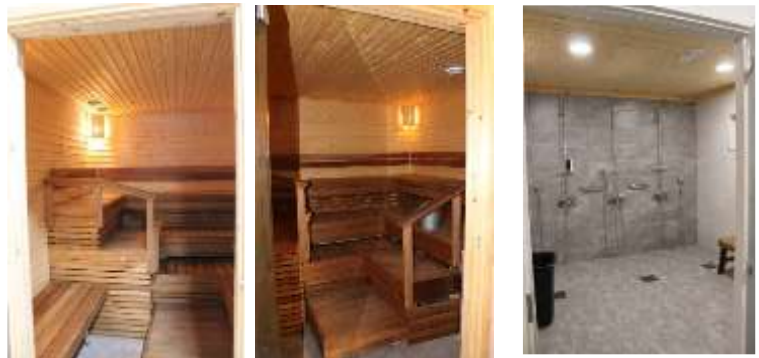
Saunatilat ovat naisille ja miehille

Rakennuksessa on myös erilliset suihkutilat ja Inva-wc, jossa on lastenhoito tila. Vuorokausi paikat sijaitsevat äärellään.